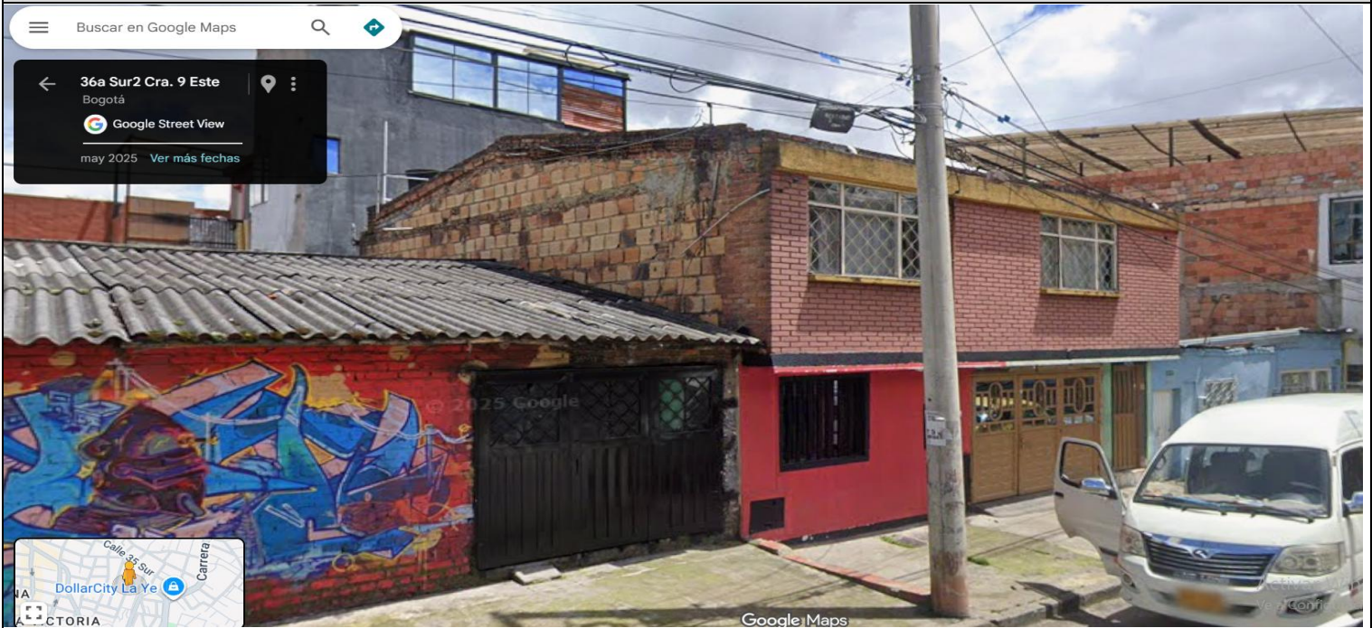
IMAGEN 1: NOMENCLATURA