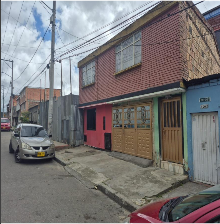
IMAGEN 3: FACHADA LATERAL